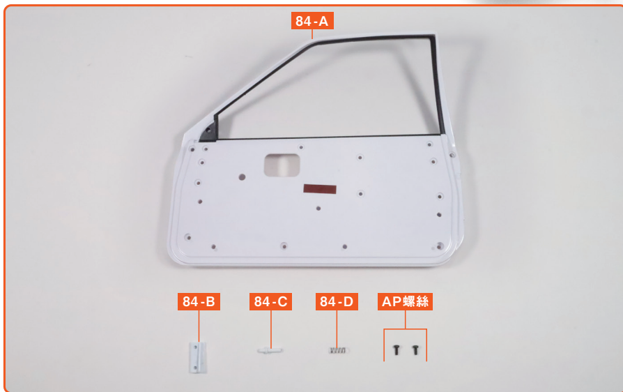
84-A 前車門內側面板 (R)

※零件名稱和組裝指南中的「左·右」是指乘坐時從駕駛座的視角來看。「右 (R)」指的是駕駛座側，而「左 (L)」指的是副駕駛座側。